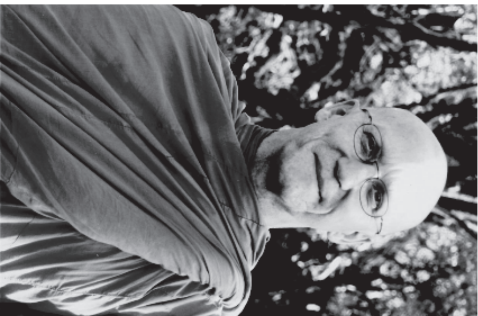
หมู่กุฎีธรรมมณเฑียร